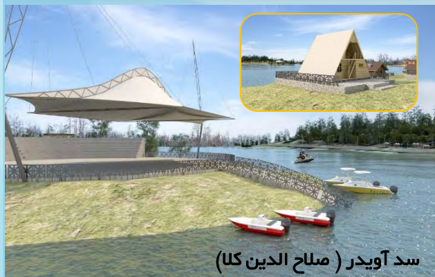
سد آویدر (صلاح الدین کلا)