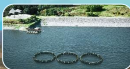
سد برنجستانک (زمزم)