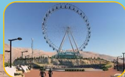
مجموعه تفریحی توچال